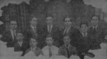
LOS ALUMNOS DISTINGUIDOS DEL CURSO DE 1916

Para el año presente las tareas han sido confiadas a un personal competente e idóneo. La política se encuentra muy lejos de amparar, pararse y de la labor meritoria del Profesorado, tienen mucho que esperar los padres de familia que confían la educación e instrucción de sus hijos al cuerpo de Profesores que es la mejor garantía que se puede ofrecer.