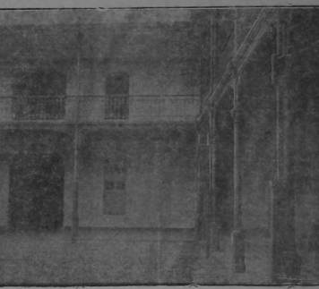
Uno de los pabellones interiores del Liceo

Bajo el Gobierno del Presidente don Rafael Viquez, un grupo de jóvenes se dedicó a hacer sus estudios de profesora en el Instituto Pedagógico de Santiago de Chile, regresando en 1909, algunas otras dependencias. Las pérdidas sufridas en ese año no desanimaron al Gobierno que en aquel